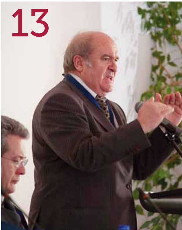
Assembleia-geral aprovou Relatório e Contas